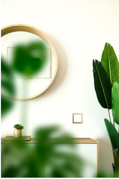
Foto: Busch-art linear® past perfect in elke omgeving met zijn onopvallende ontwerp.