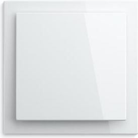
Foto: Busch-art linear® overtuigt met een tijdloos ontwerp. De eenvoudige vormen stralen niettemin elegantie uit.